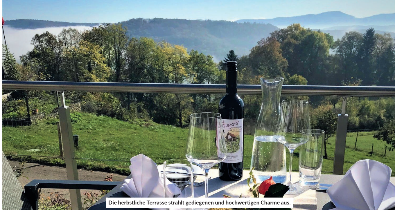
Die herbstliche Terrasse strahlt gediegenen und hochwertigen Charme aus.